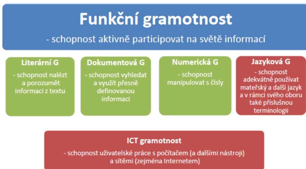
Obrázek 1 – Model funkční gramotnosti obohacení o ICT gramotnost 4

Obrázky se číslují jednotně od začátku do konce práce. Titulek se umísťuje vždy pod obrázek. Obrázek je zároveň uveden v úvodní části práce v Seznamu ilustrací a tabulek. Pro odkazování je v tomto konkrétním příkladu použita metoda průběžných poznámek.